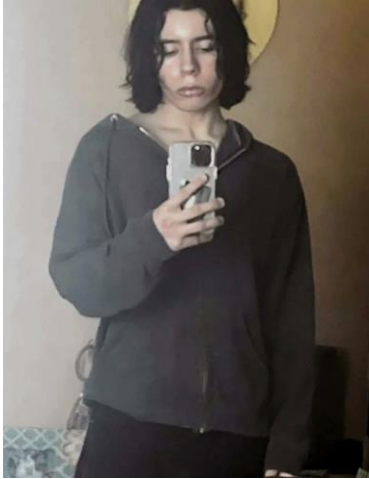
Salvador Ramos un mes antes de los asesinatos.